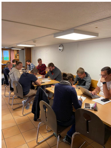
In Kleingruppen arbeiten wir die Positionen der Jungen Mitte aus.

Schweiz an. Altersvorsorge, Klimapolitik, Bildung, Familie und natürlich auch den Service Citizen. In Kleingruppen haben wir besprochen, was wir in diesen Teilbereichen konkret verändern können. Ich sah, wie viel Potential in den Ideen steckte und konnte mich auch aktiv einbringen. Die Vorschläge wurden eingehend diskutiert und das Positionspapier wenn nötig auch gleich angepasst. In einem zweiten Schritt durften wir die Vorschläge vortragen und zusammen diskutieren. Der Vorstand nahm die Vorstösse auf, damit wir sie in unsere Politik aufnehmen können. Es war beeindruckend, wie man als normales Mitglied seine Ideen in ein Positi-