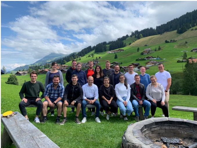
Die ganze Gruppe im schönen Adelboden.

Danke an alle, welche das Sommercamp zu einem so schönen Erlebnis gemacht haben.